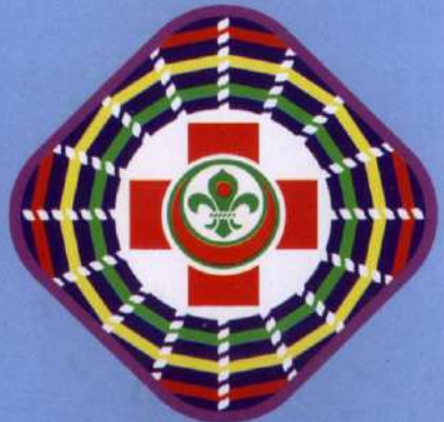
স্কাউট কর্মী ব্যাজ