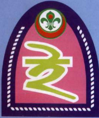
স্কাউট ইনস্ট্রাক্টর ব্যাজ